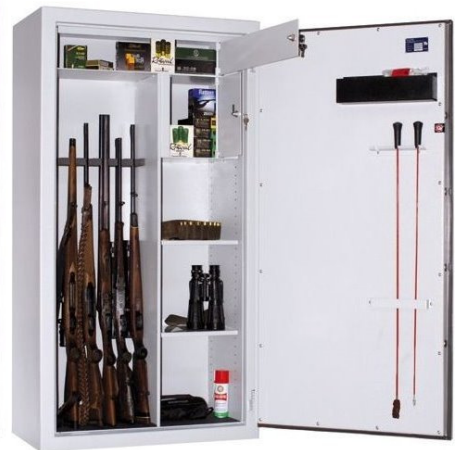
Abb. WSN 150/80